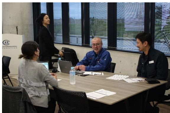
▲積極的にアイデアや意見が交わされました

浦先生の豊富な実体験に基づく具体的な解説や、グループディスカッションを通じて、参加者からは多くの「なるほど！」という反応が寄せられました。また、他部署のメンバーと意見を交わす中で、より多様な視点や有益なヒントを得る場面もあり、研修後にはその充実感が感じられました。