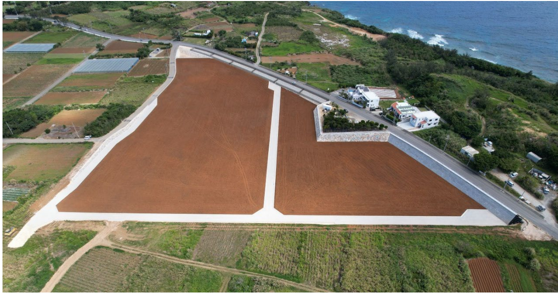
竣工写真（沖縄県中頭郡読谷村瀬名波）